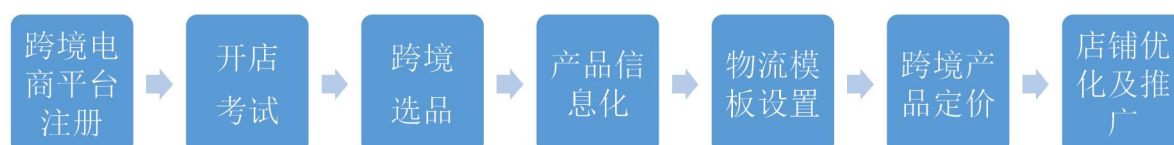
图 2 跨境电商平台运营流程图